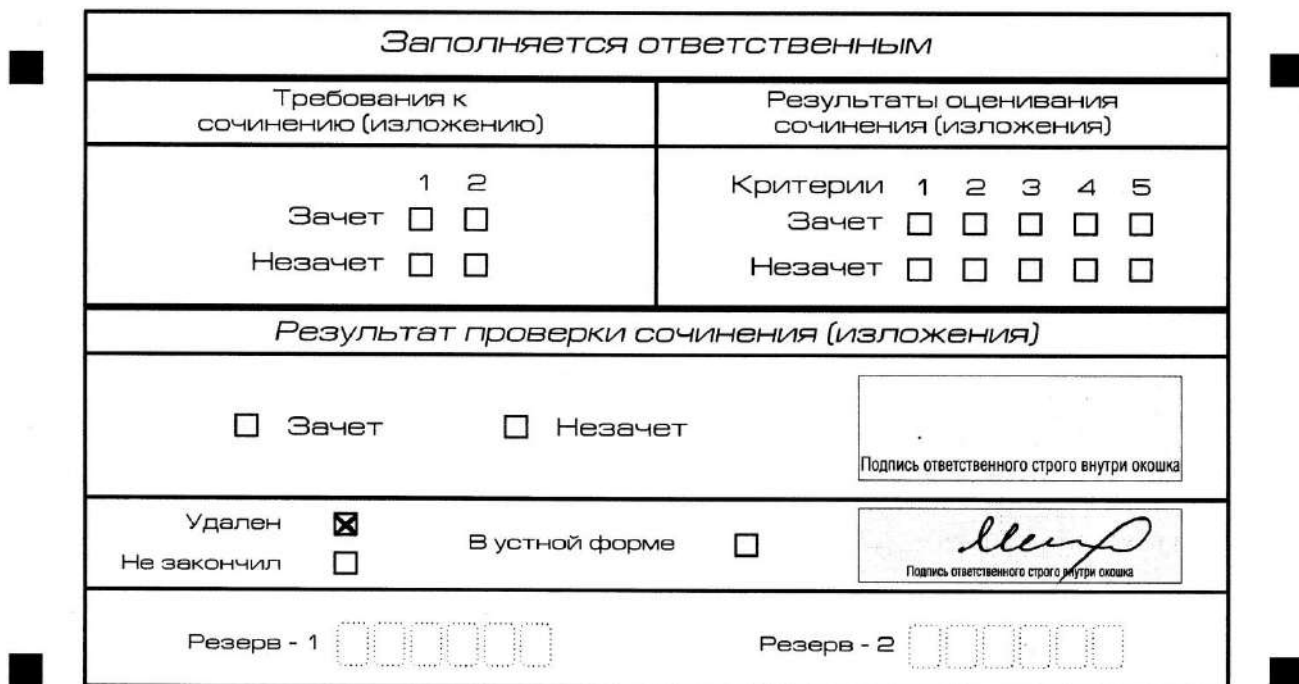
Рис. 13. Заполнение полей нижней части бланка регистрации (удаление с экзамена)

В случае если участник итогового сочинения (изложения) нарушил установленные требования, изложенные в пункте 27 Порядка проведения государственной итоговой аттестации по образовательным программам среднего общего образования (приказ Министерства просвещения Российской Федерации и Федеральной службы по надзору в сфере образования и науки от 07.11.2018 г. №190/1512), он удаляется с итогового сочинения (изложения). Член комиссии по проведению итогового сочинения (изложения) составляет «Акт об удалении участника итогового сочинения (изложения)» (форма ИС-09), вносит соответствующую отметку в форму ИС-05 «Ведомость проведения итогового сочинения (изложения) в учебном кабинете ОО (месте проведения)» (участник итогового сочинения (изложения) должен поставить свою подпись в указанной форме). В бланке регистрации указанного участника итогового сочинения (изложения) необходимо внести отметку «X» в поле «Удален». Внесение отметки в поле «Удален» подтверждается подписью члена комиссии по проведению итогового сочинения (изложения) (см. рис. 13).